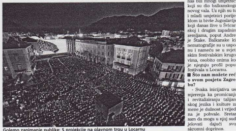
Golemo zanimanje publike: S projekcije na glavnom trgu u Locarnu

Svaka inicijativa usmjerenja ka promicanju i revitaliziranju talijanskog jezika i kulture za mene je važna i vrijedna. Je potkave. Šretan sam da mogu u njoj sudjelovati dijajući svoj skromni doprinos.