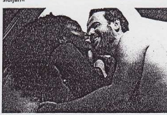
Komedija »Crno i bijelo« Cristine Comecini