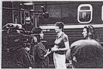
Dokumentarni film: »Sto ljudi Talijana u Pekingu« Giovanna Pipera

je riječ o 77 psihičkih bolesnika koje prati još 130 filmskih radnika, psihijatar, članova obitelji i volontera. Ne treba napominjati da su različiti ljudi, različitih potreba i ritma na malom prostoru kao što je vlak odličan materijal za snimiti vanserijski film.