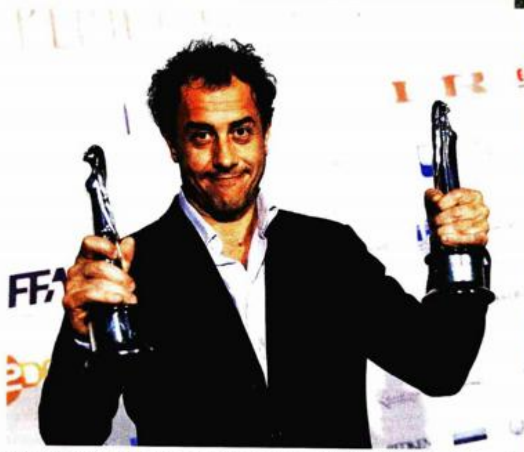
MATTEO GARRONE Redatelj filma "Gomora", koji je dobitnik pet najvažnijih europskih filmskih nagrada i velike nagrade žirija u Cannesu

Sistem se čini kompliciran, no nema druge. Akademija je neprestano pod udarom kritika da je Oscar za strani film postao