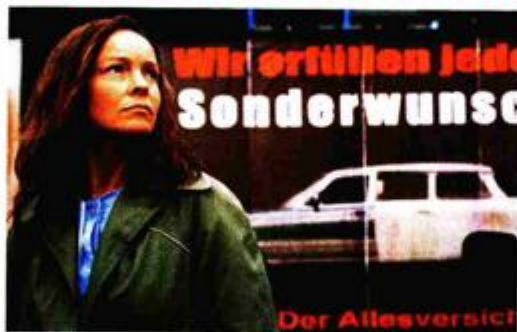
GOOD-BYE LENIN Scena iz filma Wolfganga Beckera, iz 2003.