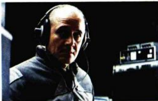
ŽIVOT DRUGIH Politizirana melodrama Floriana Henckela von Donnersmarcka