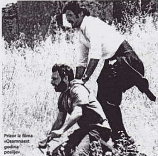
Prizor iz filma »Osamnaest godina poslije«

međutim, ranije nisam bio spreman raditi filmove, no postoje doista mladi ljudi u ranim dvadesetima koji imaju izniman talent za režiju, ali ne mogu dobiti šansu.