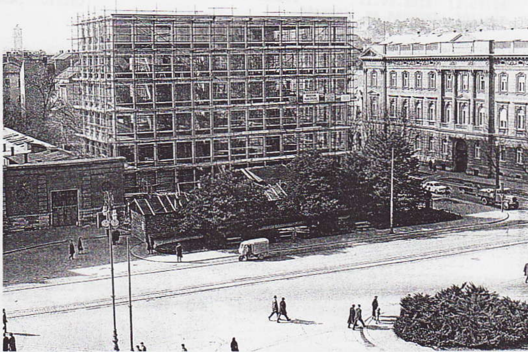
Ferimport čeka užurbane radove na stvaranju nove zgrade Muzičke akademije

Nakon mnogobrojnih problema od 5. ožujka projekt se vidljivo miče s mrtve točke, a trenutak pretvorbe namjene bio je idealna prilika za stvaranje konceptualnog umjetničkog djela koje je na pamet palo jednom Talijanu: mladom Venecijancu s amsterdamskom adresom i diplomom iz kiparstva Giorgiu Andreotti Calóu. Konceptualna umjetnost u Italiji ima snažnu scenu, koju je hrvatska publika mogla barem djelom upoznati tijekom veljače na izložbi Tišine gdje stvari napuštaju sebe . Jedanaestoro mahom mladih vizualnih umjetnika izlagalo je svoja djela u Novoj galeriji u prizemlju zagrebačkog Muzeja suvremene umjetnosti, uz potporu Talijanskoga kulturnog instituta i u koordinaciji Iliomira Milovca. On je u Zagreb prenio ideu u svojih talijanskih kolega: „Ilari Valbonesi i Alessio Fransoni kustosi su mlade generacije s kojima sam počeo zanimljivu i dobru suradnju u Italiji i Hrvatske, našeg muzeja i sličnih talijanskih institucija. Izložba je koncipirana u odnosu na refleks koji su kustosi pronašli među talijanskim umjetnicima, ali i u odnosu na hrvatsku